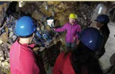
Rudnik Sitarjevec je spet odprt za javnost.