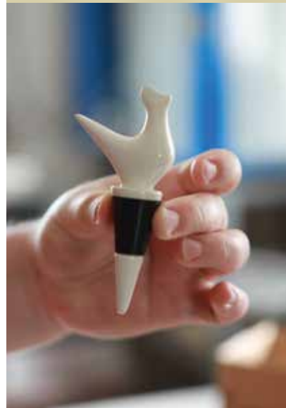
Keramični izdelki Silvije Goršin