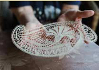
Čipka Mojce Peček