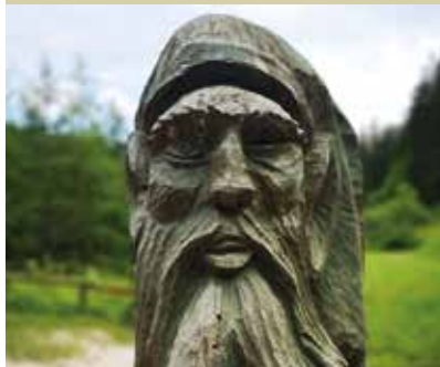
Škrat Perkmandlc, ki ga je izdelal Rudi Novak

To je legenda o Perkmandlcu – rudarskem škratu, ki nas opozarja, da človek nikoli ne sme biti lakomen, saj lahko zaradi tega izgubi vse, kar ima. Opisani legendi lahko v živo prisluhnete točno tam, kjer je škrat doma – v nekdanjem rudniku svinca in cinka v Mežici, danes turističnem rudniku in muzeju, ki vabi na dogodivščine. Skozi rudnik se obiskovalec lahko poda z vlakom, s kolesom ali kajakom. Rudarstvo je močno zaznamovalo kraj in prebivalce. Zaradi izjemne kulturne, geološke in naravne dediščine je Mežica ena izmed štirinajstih občin, ki so vključene v čezmejni Geopark Karavanke.