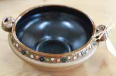
Skleda Irene Blaznik