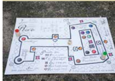
Igra o zaroti na gradu Rače, ki so jo izdelali v CDUO Slovenska Bistrica