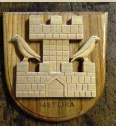
Rezbarjen izdelek grba

Turki so še večkrat napadli Metliko, vendar so se Metličani junaško borili. Zato so dobili mestne pravice in Metlika je postala mesto. Osameli stolp požganega Pungarta se je sesul, da ni ostala niti sled o gradu. V spomin na Pungart so Metličani v mestni grb narisali grajski stolp in na njem dva črna krokerja.