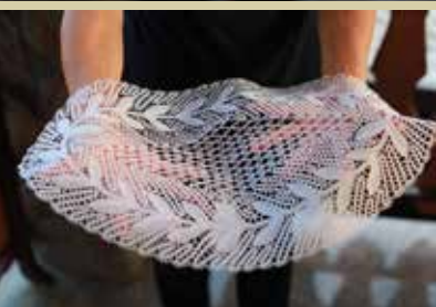
Čipke Stanke Dolensšek, članice Žnurc