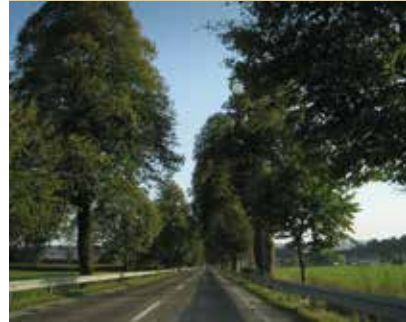
Napoleonov drevored v Logatcu

Kose obrušene in zglajenega lesa podobnih oblik so včasih, ko še ni bilo sodobnih materialov, matere dajale dojenčkom, ko so jim rasli zobki, da so si z njimi drgnili boleče dlesni.