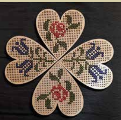
Leseno srce z izvezenimi cvetličnimi motivi