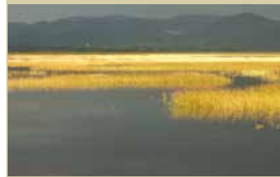
Jezero, ki vedno znova očara in preseneti