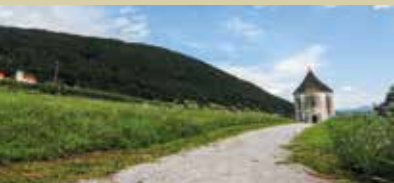
Pogled na Hudičev turn v Soteski