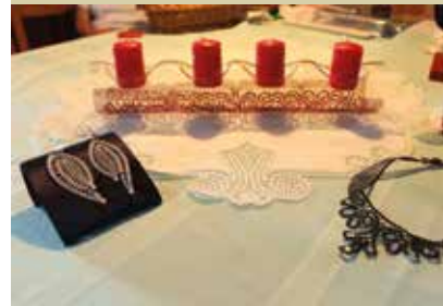
Klekljane čipke članic TŠD Kostel