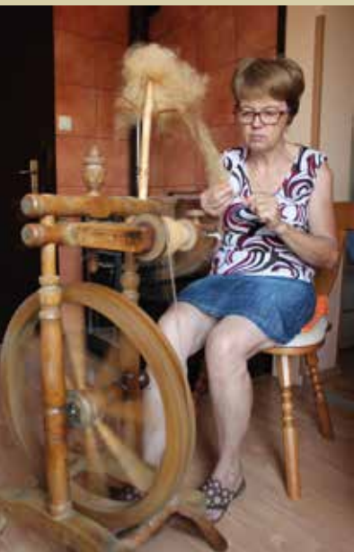
Članice Društva upokojencev še ohranjajo znanje predenja.