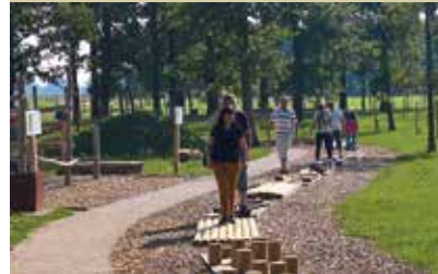
Park doživetij Križevci