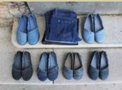
Maja Modrijan, balerinke iz starih hlač