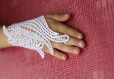
Rišelje čipka Miroslave Tomšič