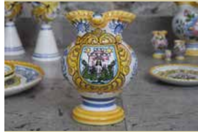
Veronika z Malega gradu, upodobljena na kamniški majoliki, delo Hiše keramike