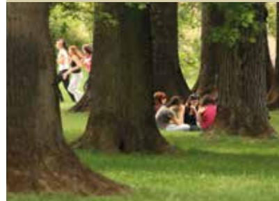
Mladost med stoletnimi hrasti