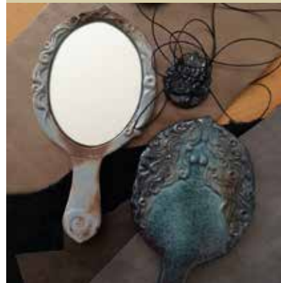
Veronikin lepotilni pripor in nakit; sodobna upodobitev kamniške Veronike kot svobodne ženske, ki se upa zoperstaviti in postaviti zase, delo Hiše keramike.

Več informacij: www.kamnik-tourism.si www.srce-slovenije.si