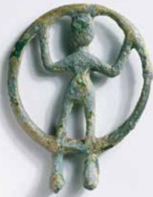
Orant ali molivec iz prvega stoletja pr. n. št.

Orant je postal prepoznaven znak občine Šmarješke Toplice, saj je osrednji lik celostne podobe Hiše žive dediščine, medgeneracijskega interpretacijskega centra dediščine. Njena vsebina nudi vpogled v življenje lokalnih prebivalcev skozi različne zorne kote in zgodovinska obdobja ter na inovativen način predstavi bogato kulturno dediščino območja Šmarjeških Toplic.