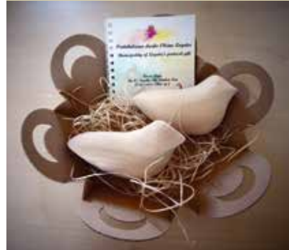
Protokolarno darilo Občine Logatec, ki ga prejmejo občinski nagrajenci