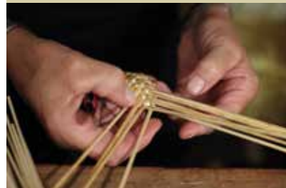
Umetnost pletenja slamatih kit

Več informacij: www.lukovica.si www.srece-slovenije.si