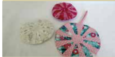
Dišeče tekstilne broške in okrasne gumbke za dom, odišavljene z izbranimi zelišči, je izdelala Karmen Rozman iz Litije.