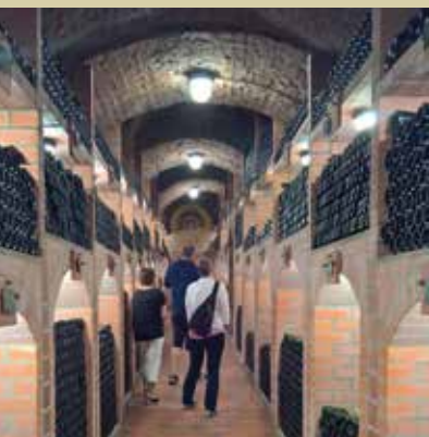
Klet Radgonskih goric