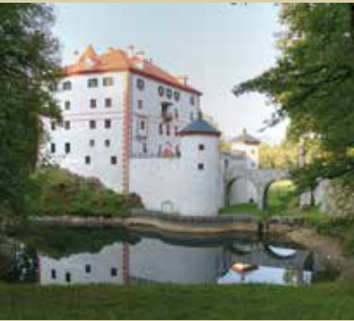
Grad Snežnik, eden od dveh gradov v Sloveniji z ohranjenimi avtentičnimi interierji.