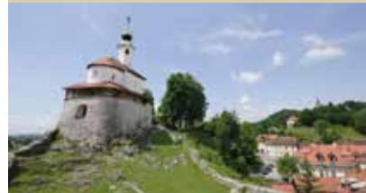
Mali grad daje Kamniku značilno podobo.

V Kamniku od nekdaj ohranjajo spomin na nesrečno Veroniko tako, da so jo upodobili v mestnem grbu. Veronika je bila pogost motiv v poslikavi imenitne kamniške majolke, stenskih krožnikov in drugih izdelkov iz Eti Svit, znane kamniške tovarne, ki je žal leta 2008 prenehala z izdelovanjem beloprstene keramike. Danes rokodelsko tradicijo značilne kamniške keramike ohranjajo v KUD Hiša keramike, zakaj pa ne majolka in jo nadgrajujejo s sodobnimi vsebinami.