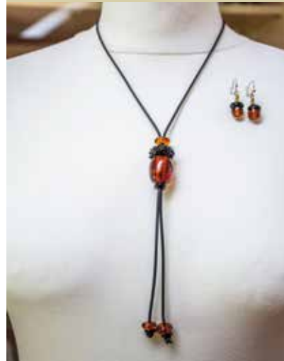
Želod starega hrasta - nakit, Bionera s.p. Natalija Kukec

Danes se obiskovalci Apaške doline radi utaborijo blizu očeta panonskih hrastov in taborjenje popestrijo s kolesarjenjem vzdolž slikovite reke Mure. Za gramoznice, kjer so odkrili dragocenega očaka, skrbijo ribiči. Urejajo jih in negujejo kulturno krajino, ki zlagoma prehaja v loko proti Muri. Skupaj z ostalimi domačini še upajo na oživitev enajstmlinskega kanala. Simbolna vež današnjih dni in burnega zgodovinskega obdobja iz časa rasti očeta panonskih hrastov je zapisana v izvornem nakitu, stalnici vseh kultur in civilizacij.