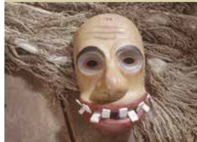
Lesena larfa Ta terjastega iz družine cerkljanskih laufarjev, izrezljana iz lipovega lesa

Lesena kolesa se predstavljajo pod blagovno znamko Annum, ki v latinščini ponazarja leto, in predstavljajo čas, ki ga posvetimo samo sebi. Kot letnice na deblu drevesa so dokaz trdoživosti, starosti, izkušenj in doživljajev. Oblikujeta jih vsa unikatnost in energija slovenskega oreha, jesena, češnje ali javorja. Na inovativen tehnološki način obdelan les zagotavlja trdnost in elastičnost ogrodja ter združuje vse vidike trajnostno grajenega vrhunkega izdelka.