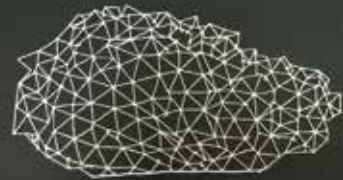
Meteorit, klekljana čipka Lucije Petrušič, avtorica vzorca Mira Časar