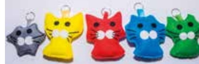
Mačje mesto - obeski, VDC Gornja Radgona