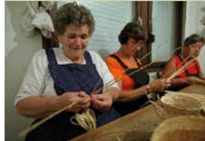
Pletenje kit iz pšenične slame ohranjajo in prenašajo na mlajše rodove v KUD Fran Maselj Podlimbarski iz Krašnje.