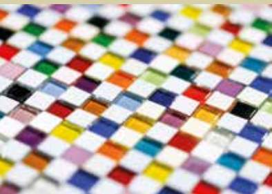
Srečko Likar, mikro mozaik