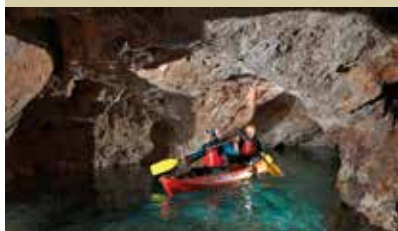
S kajakom skozi turistični rudnik v Mežici