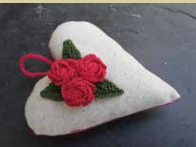
Srce iz blaga s kvačkanimi vrtnicami

Ljubezni ne moreš zahtevati, tudi iskati se je ne splača. Ljubezen te najde, ko jo najmanj pričakuješ. Nad Moravško dolino se dviguje gora, na kateri je davno stal mogočen grad. Na gradu je živela svetlolasa Lilija, edina graščakova hči. Starša sta jo imela neznansko rada in njuna želja je bila Lilijina sreča. Le malo pred šestnajstim rojstnim dnem je Lilija sedela na jasi in zaslišala prečudovito glasbo. Sledila ji je in ob potoku zagledala fanta, ki je igral na piščal. Ko ga je poklicala, je fant izginil v gozdu. Lilija ga je hotela ponovno slišati na rojstnem dnevu in oče ji je ustregel. Na grad je povabil vse, ki so igrali na piščal. Med njimi je bil tudi mladi pastir. Ko se je Lilija zazrla v njegove oči, jo je preplavilo čustvo, ki ga prej ni poznala. A pastir je tudi tokrat izginil. Ko je čez dve leti graščak iskal primerne ženine, je Lilija vztrajala, da mora to biti nekdo, ki ji bo podaril najlepše darilo in zaigral najlepšo pesem. Upala je, da se bo izbranec njenega srca vrnil. In res je prišel. Liliji je prinesel zelena stebelca, in ko je zaigral na piščal, so na stebelcih zacvetele prečudovite bele rože. Lilija se je poročila s pastirjem. Rože, ki so odtelej rasle okoli gradu, pa so poimenovali po njej. Na Moravškem rečejo liliji tudi limbar, gora, na kateri je stal grad, pa je Limbarska gora.