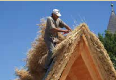
Prekrivanje slovanskih zemljank

Biosferno območje ob reki Muri je dobilo potrditev z vpisom na UNESCOV seznam območij posebnega pomena. Pestra narava v murskih lokah ponuja številne posebnosti. Ena teh je modro obarvana žaba, ki jo v deželi ob Muri najdemo le nekaj dni v letu. Samci se v času parjenja iz rjave obarvajo modro in s tem privabijo samice k parjenju. Barvit obred spremlja glasno regljanje. Če ga želimo ohraniti, naj ostane našim očem skrito. Domišljiji in radovednosti lahko damo krila z upodabljanjem te naravne posebnosti v rokodelskih izdelkih.