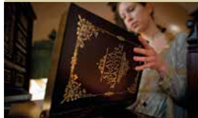
Janez Vajkard Valvasor je izkazal zanimanje za zelišča že v Slavi vojvodine Kranjske.