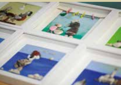
Edita Čotar, slike iz kamnov