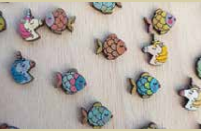
Uhani ribice Manje Kos Lesar