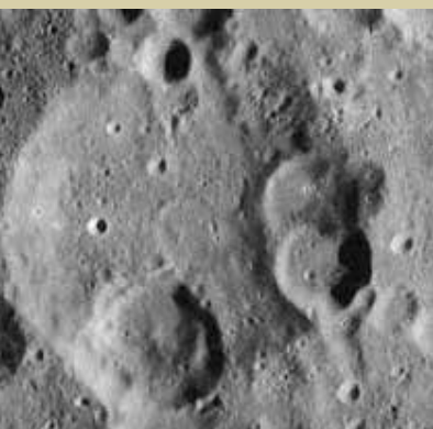
Krater Vega na Luni, poimenovan po Juriju Vegi