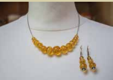
Mehurčki penine - nakit, Bionera s.p. Natalija Kukec