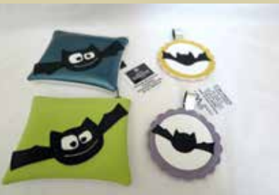
Netopir mali podkovnjak, ki živi v rudniku Sitarjevec, je spodbudil k ustvarjanju varovance litijske enote VDC Zagorje ob Savi, da so ga upodobili na raznih uporabnih izdelkih.

Litija je Srce Slovenije, Sava pa srce Litije. Občina povezuje kraje od Geometričnega središča Slovenije do z lesom bogate Oglarske dežele na Dolah pri Litiji. Središče je ob nekoč prometno živahni reki Savi v mestu Litija. Mesto na obeh bregovih Save je obdano s Posavskim hribovjem s številnimi pohodniškimi in kolesarskimi potmi. V Litijo vabi rudnik Sitarjevec, ki se je po dobrih petdesetih letih prebudil iz pozabe.