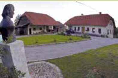
Vehovčeva domačija v Zagorici, Dol pri Ljubljani