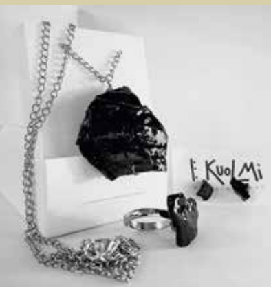
Nakit iz premoga

Prvi so našli premog leta 1755 v Zagorski dolini. Sprva zaradi nikakršnih prometnih poti ni bil pomemben, po letu 1795, ko je Belgijec Leopold Ruard odprl rudnik, pa vse bolj. Danes se po njem imenuje področje Ruardi z rekreativnim centrom in letališčem. Zagorje je bilo sredi 19. stoletja središče premogovništva in topilniške industrije na Slovenskem. 240 let po prvi izkopani rudi v Zagorju se je država odločila, da rudnik zapre.