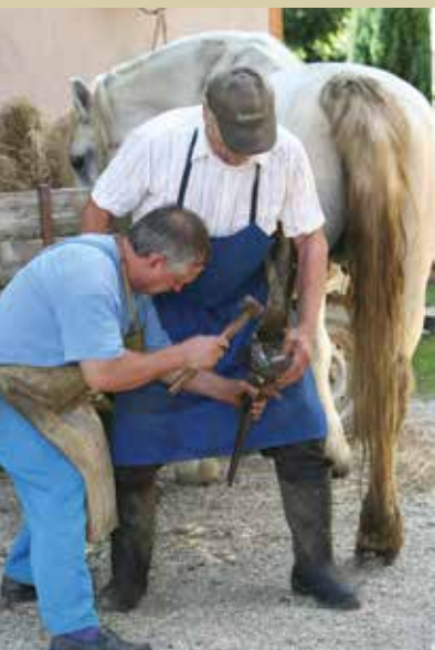
Kovač v Razkrižju