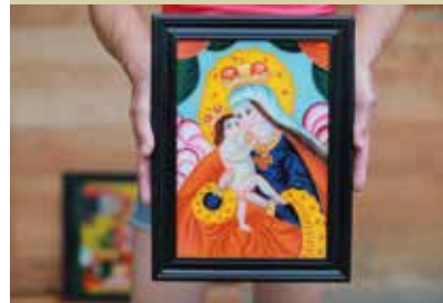
Slike na steklu Irene Jurjevič