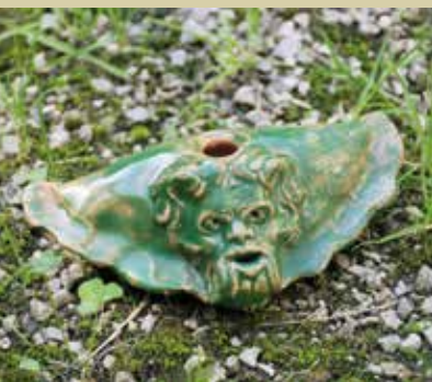
Vodovnikova piščal Natalije Zorko