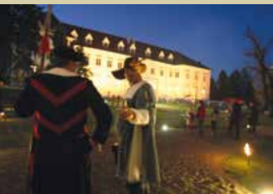
Vitezi na negovskem gradu

Po sredini mejnega odseka reke Mure teče državna meja z Avstrijo in loči slovensko Gornjo Radgono od avstrijskega Bad Radkersburga. Vsak od obeh delov dvodržavnega mesta ima svoje čare. Prebivalci obeh strani pogosto prečkajo mejo po lepem obnovljenem mostu in urejenem nabrežju. Največje zanimanje na avstrijski strani pritegnejo tamkajšnje terme, na slovenski strani pa živahen sejmski utrip in klet radgonskih penin. Kmetijski sejem v Gornji Radgoni obišče vsako leto več kot sto tisoč obiskovalcev. Tem se pridružijo številni gostje drugih sejmov, ki dopolnjujejo sejmsko ponudbo pomurske regije. Radgonska peniča vina pa slovijo po vsej Sloveniji in onkraj meja ter imajo najbogatejšo tradicijo v vsej državi. V Radgonski kleti znanje o peninah prehaja iz generacije v generacijo, vse od davnega leta 1852. Dobra klima in izjemne vinogradniške lege postavljajo radgonske penine v sam vrh tovrstne pridelave in prepoznavnosti.