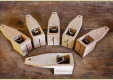
Bojan Štefančič iz Puboda nadaljuje tradicijo izdelovanja lesenih pasti za polhe.