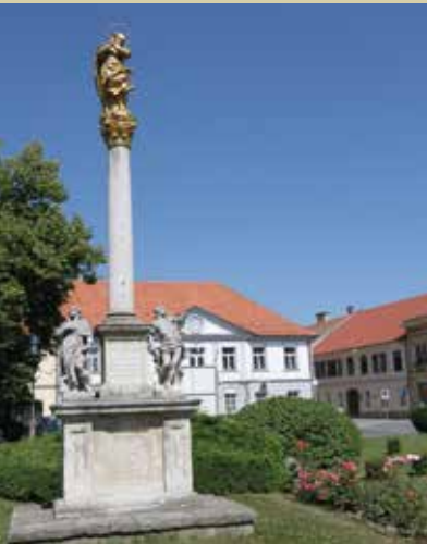
Kužno znamenje v Ljutomeru