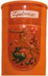
Samorog v ljutomerskem grbu - hladilna posoda za vino Saše Žuman