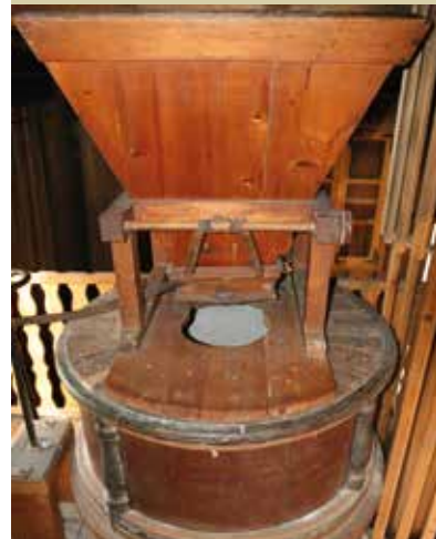
Notranjost mlina na veter