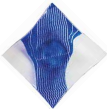
Ivanov izvir - stekleni podstavek, VDC Gomja Radgona