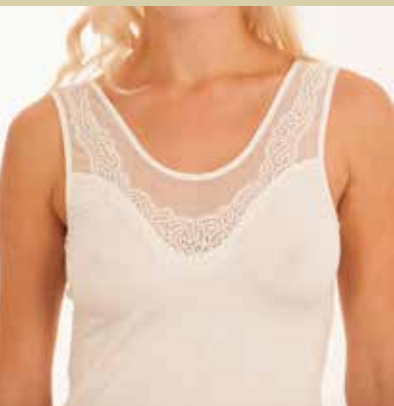
Oblikovali Maja Svetlik in Nataša Brinjevec, čipke je izdelala Metka Fortuna.