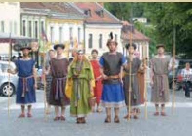
Praznik situl v Novem mestu

Območje današnjega Novega mesta je bilo poseljeno že pred dva tisoč leti, o čemer pričajo arheološke izkopanine. Za ustanovitev mesta štejemo 7. april 1365, ko je Rudolf IV. Habsburški podelil posebne pravice in postave mestne naselbine. Ena glavnih mestnih pravic, ki jih je mesto prejelo, je bila pravica do trgovanja.