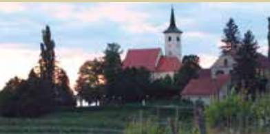
Jeruzalem med vinogradi

Ljutomer je neizbrisljivo povezan s konji. Znan je kot zibelka reje avtohtone pasme kasaških konj. Ljutomerski kasači krasijo Ljutomer in Prlekijo tudi v simbolnem smislu. V ljutomerskem grbu je v ospredju podoba konja – samoroga, ki se vzpenja nad pretečim zmajem. Spomin na mitološka bitja odpira globlji vpogled v naravo tukajšnjega človeka, ki živi v kraju s skoraj tisočletno tradicijo mestnega trga, a je ohranil pristni stik z naravo. Samorog simbolizira neukrotljivo moč narave in lepote, ki nas hkrati straši in ponuja čudodelno zdravilo. Le nežni devici je dano ukrotiti samoroga, ki nas spominja na nezavedni del naše biti in pooseblja transcendenco, prenekaterikrat doživeto prav v nemirni Prlekiji. Eruptivna moč samoroga nam pomaga razumeti naravo tukajšnje biti, njeno lepoto in deviškost, ki jo razkriva tudi prleški dialekt.