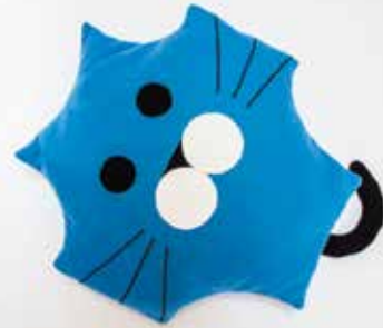
Mačje mesto - vzglavnik, VDC Gornja Radgona

Malo krajev na svetu se lahko pohvali z naravnimi vrelci slatine. V občini Radenci pravijo tem vrelcem »buble«, saj z izvirsko mineralno vodo kar naprej spuščajo mehurčke in se ob tem brbotanju oglašajo – bublajo, kot rečejo domačini. O bublah je več legend. Prva pravi, da bublajo škrati, ki s kopanjem podzemnih rogov utirajo pot zdravilni vodi. Druga pravi, da bublajo coprnice, ki v kotlu pod vrelci kuhajo cmoke. Tretja pravi, da vrelci bublajo, ker zbirajo grom in točo. Vsakdo naj izbere tisto, v katero bo verjel, o bublanju pa se lahko prepričate tako, da prislonite uho na zemljo tik ob vrelcu in pozorno prisluhnete.