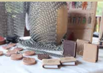
Spomeniki Rokodelske družine Grčar, povezani z gradom Turjak in pisatelji