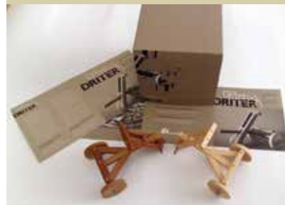
Driter, otroški tricikel iz rudniških kolonij