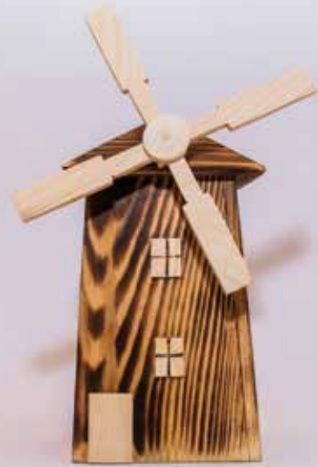
Mlin na veter - šparovček iz lesa, Valerija Cer

Iz šibe spleteni koši in košare danes niso pogosto v rabi, vsaj ne toliko kot takrat, ko se je mlin na veter vrtel ob vsakem vetrovnem dnevu. O iznajdljivosti prednikov, ki so vsa dela zmogli sami, pričajo orodja in delovni pripomočki, razstavljeni v stari šoli na Stari gori. Večina orodij je iz okoliškega lesa, zato ne preseneča, da se tukajšnji rokodelci spominjajo varčnosti prednikov z domiselnimi lesenimi hranilniki v obliki mlina na veter.