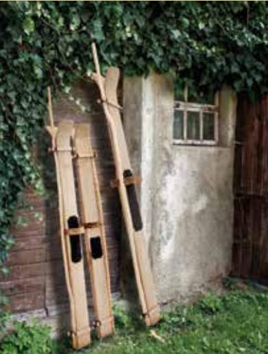
Smuči ali po bloško sm'či, ki jih izdeluje Miran Šraj