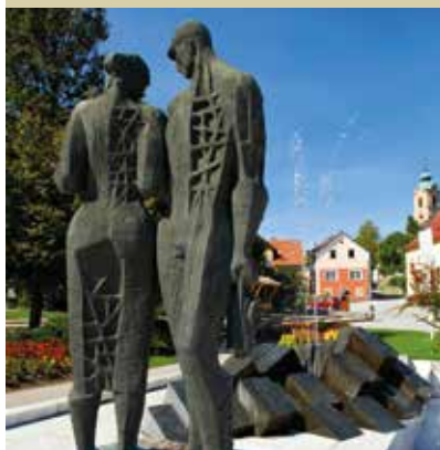
Spomenik rudarjem v Mežici

Več informacij: www.podzemljepece.com www.mezica.si