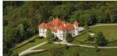
Sloviti grad Bogenšperk, ki se dviguje nad okoliškimi vasmi.

Sam Valvasor pa tudi vsebine iz vsakdanjega življenja ljudi, ki jih je Valvasor raziskoval in o njih pisal, so danes v navdih lokalnim ustvarjalcem.