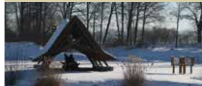
Oče panonskih hrastov