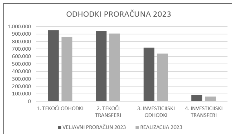
Graf 2: Realizacija odhodkov glede na veljavni proračun leta 2023